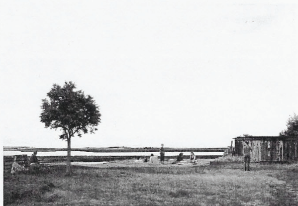
Beate Gütschow, „LS #17“, C-Print, 2003

Beate Gütschow greift die Tradition der klassischen Landschaft fotografisch auf. Nicht gezeichnete Skizzen, sondern jeweils zwanzig bis dreißig Fotos, die sie selbst auf Spaziergängen macht, verschmelzen durch Bearbeitung am Computer zu einem scheinbar zusammenhängenden Landschaftsraum. Aber auch der touristische Knipser, der seinen vergeblichen Traum zunächst realisiert wähnt, dürfte bald stutzig werden. Wo sollte denn die Künstlerin die arkadische Szenerie zusammen mit den Jeans und T-Shirts tragenden Campierern vor die Kamera bekommen haben? Oder die Parklandschaft mit den Baumgruppen, wie sie der englische Romantiker John Constable kaum stimmungsvoller ins Bild gesetzt hätte?