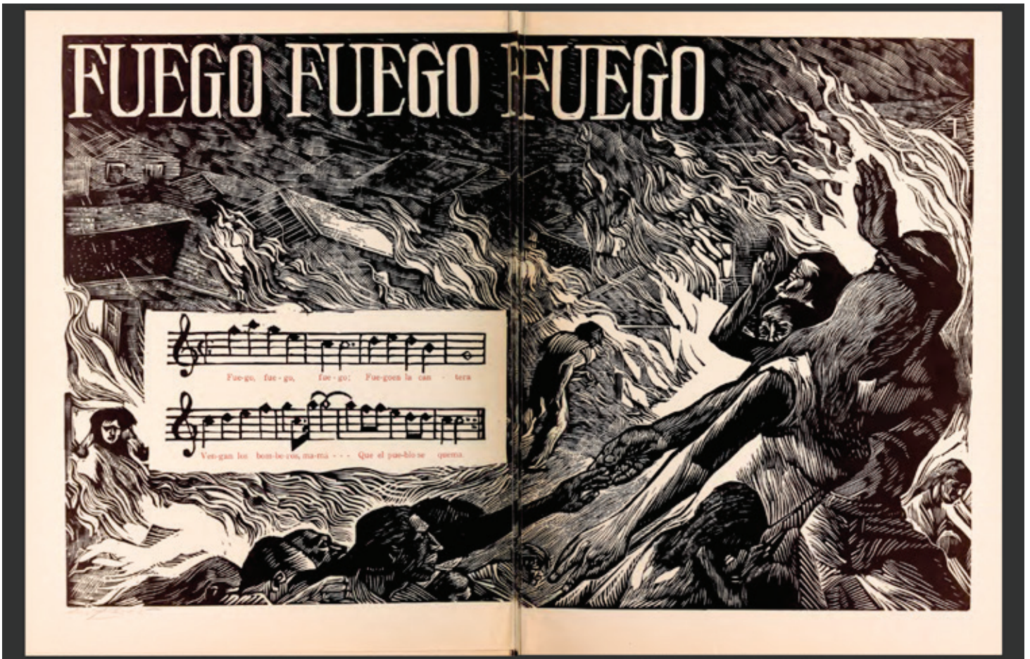
Lorenzo Homar (Puerto Rican, 1913–2004), Plenas: 12 Grabados de Lorenzo Homar y Rafael Tufiño (1953); Source: University of North Carolina Chapel Hill Open Content Alliance *Not in exhibition

Las letras de la plena Fuego, Fuego, Fuego se muestran en esta sala junto con imágenes de manifestaciones posteriores a PROMESA, con especial atención en las protestas que exigen la destitución del gobernador en julio de 2019.