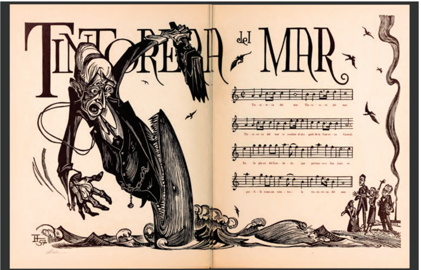
Lorenzo Homar (Puerto Rican, 1913–2004), Plenas: 12 Grabados de Lorenzo Homar y Rafael Tufiño (1953); *Not in exhibition

Las letras de la plena Tintorera del Mar se muestran en esta sala junto con imágenes de archivos del FBI conservados sobre activistas en favor de la independencia para investigar los intentos de reprimir a los activistas y los esfuerzos a favor de la independencia.