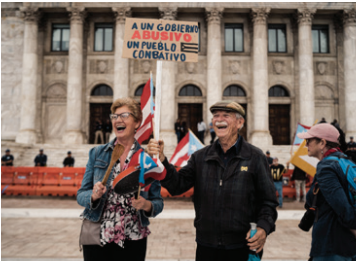
ARRIBA: Eduardo Martínez, Untitled , 2017 ABAJO: Eduardo Martínez, Untitled , 2020