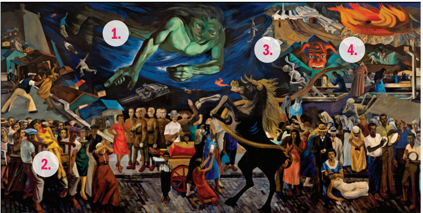
Rafael Tufiño, La Plena , 1952–1954, colección del Museo de Arte de Puerto Rico, San Juan